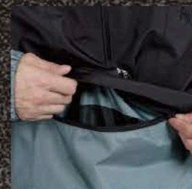
フロントビッグポケット