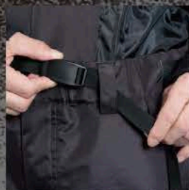
ウエストクロージャーベルト