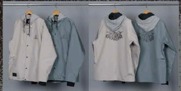
TOY WING BEIGE TOY WING KHAKI