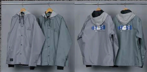
TOY SECT GRAY TOY SECT KHAKI