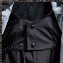
ジャケットウエストゲーター