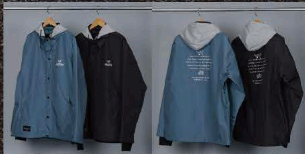
TOY MONSTER NAVY TOY MONSTER BLACK

AW × THRASHER HARDWEAR SKATEBOARD MAGAZINE