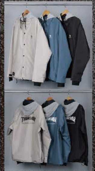
THRASHER BEIGE THRASHER NAVY THRASHER BLACK

AW × THRASHER HARDWEAR SKATEBOARD MAGAZINE