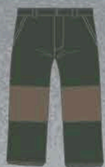
ARMY GREEN/SAND KHAKI