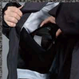
ゴーグルポケット