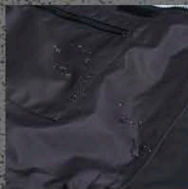
2 OR 3 LAYER WATER PROOF DUPONT™ / TEFLON® COATING