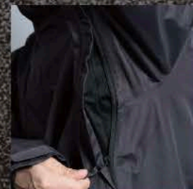
サイドベンチレーション