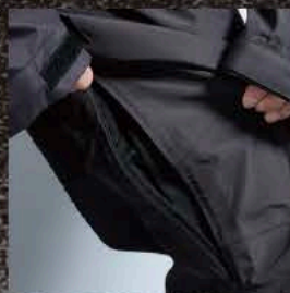
パンツベンチレーション