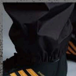
スリプレスボトムギャザー