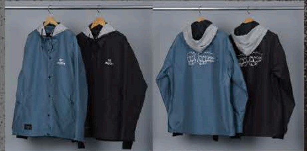
TOY FIST NAVY TOY FIST BLACK