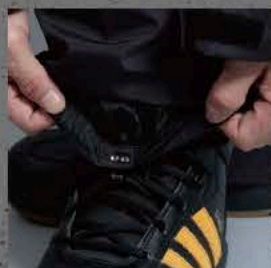
シューレースフック