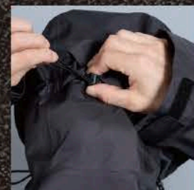
フードシルエットアジャスター