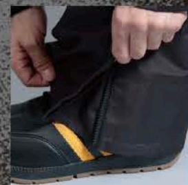
シルエットアジャストボトムジップ