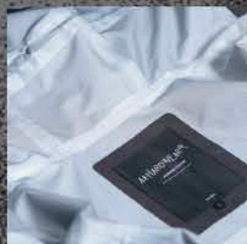
FULL OR SECTION SEAM SEALING