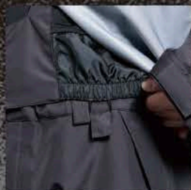
ウエストゲーターフック