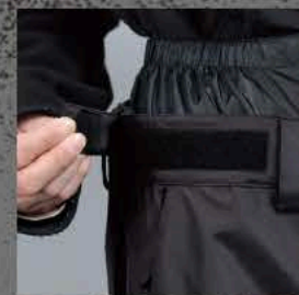
ウエストアジャスターベルト